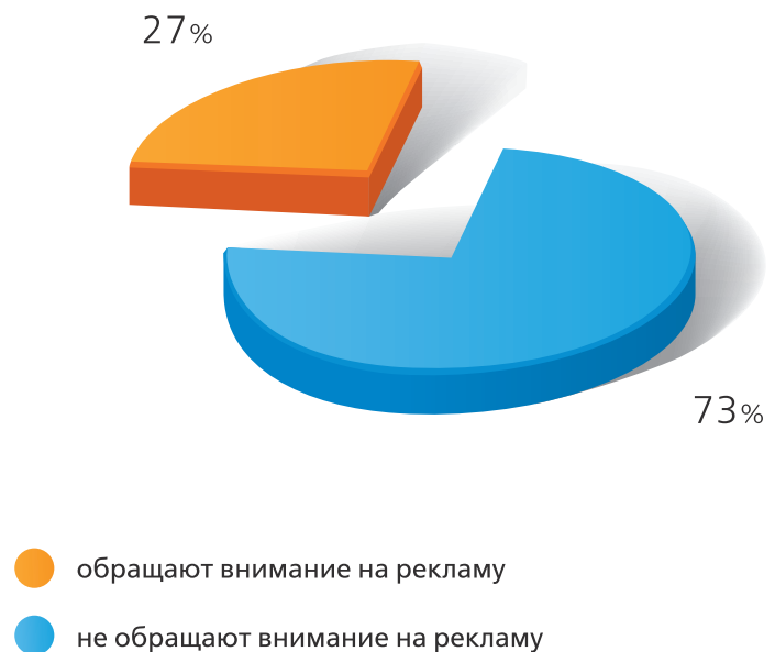
рис. 4 Эффективная реклама в торговых точках