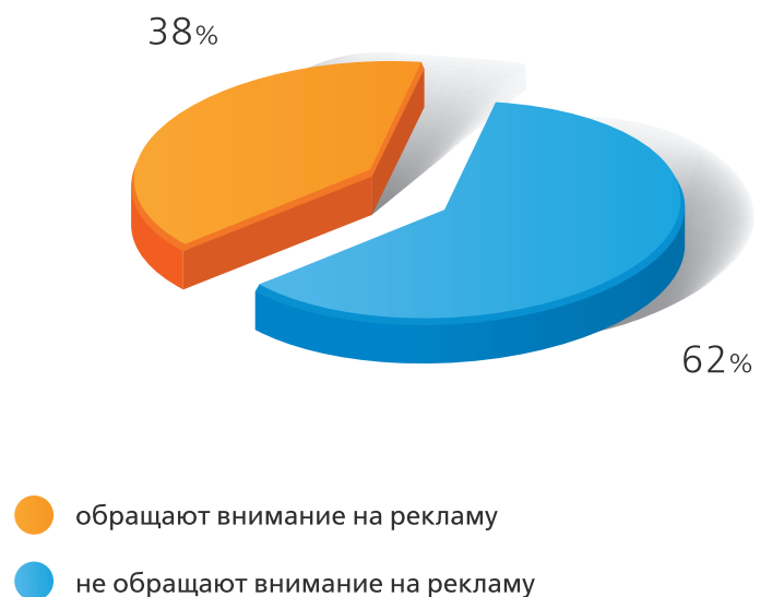
рис. 2 Эффективная реклама в торговых точках

Отношение покупателей к рекламе в магазинах (%)